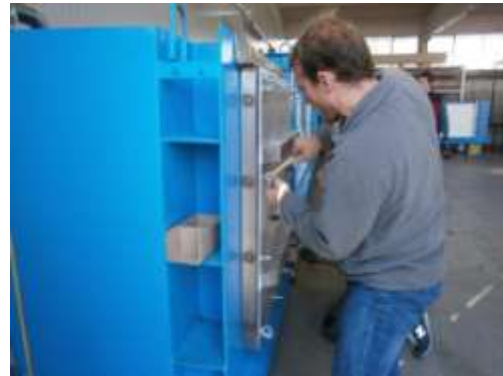
Bild 6.2-4: Fixierung Aluminiumplatte