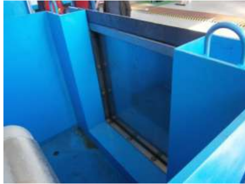
Prüfbox nach dem Einbau des Hochwasserschutzsystems, innen

Die Prüfbox wurde ordnungsgemäß in einer Werkhalle aufgestellt. Die nicht-mobilen Teile des Systems (seitliche Führungsschienen) sind bereits montiert.