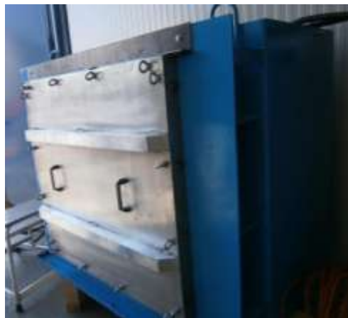
Prüfbox nach dem Einbau des Hochwasserschutzsystems, außen