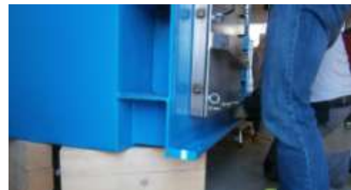
Bild 6.2-6: Fixierung Aluminiumplatte