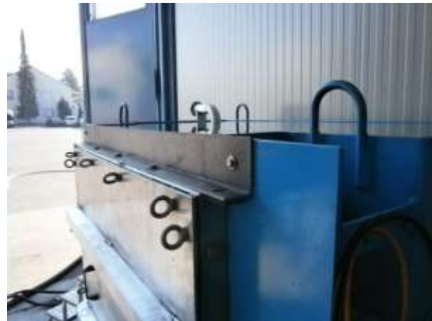
Bild 5-4: Befestigungsschrauben der Messeinrichtung