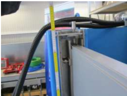
Bild 6.2-5: Fixierung der Dammbalken mittels Vertikalspanner