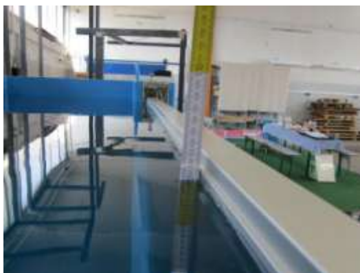
Bild 6.3-3: Wasserstand