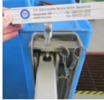
Bild 5-2: U-Aufnahme und Dammbalken mit Vertikalspanner