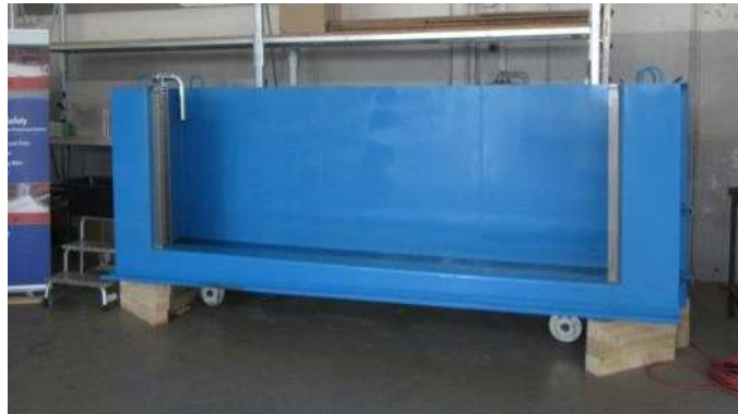
Prüfbox vor dem Einbau des Hochwasserschutzsystems

Die Prüfbox wurde ordnungsgemäß in einer Werkhalle aufgestellt. Die nicht-mobilen Teile des Systems (seitliche Führungsschienen) sind bereits montiert.