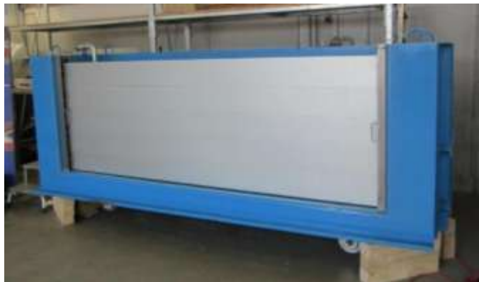
Prüfbox nach dem Einbau des Hochwasserschutzsystems

Bild 6.1-1: Ansicht Versuchsbox mit und ohne Hochwasserschutzsystem