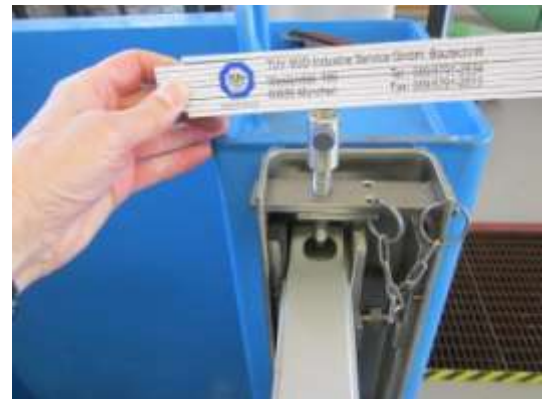
Bild 6.2-6: Fixierung der Dammbalken mittels Vertikalspanner