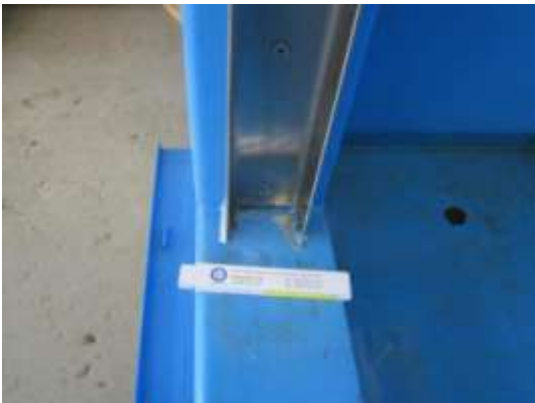
Bild 5-3: U-Aufnahme der Messeinrichtung