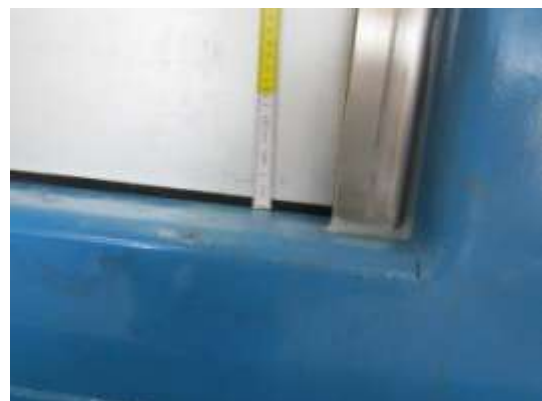
Bild 5-6: Unterer Anschluss des U-Aufnahme und Dammbalken mit Sohlendichtung