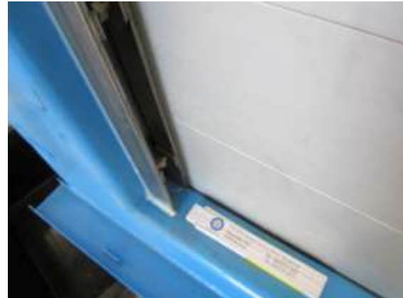
Bild 6.3-2: Wasseraustritt in den Ecken der Sohlendichtung / U-Aufnahme